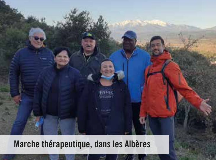
Marche thérapeutique, dans les Albères